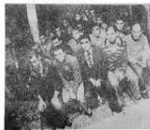
Πάνω άπό 150.000 πολιτικοί κρατούμενοι