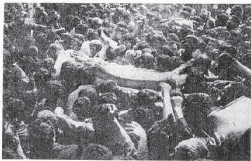
Η ημερία των Μπακονάε, τῶν εργαζομένων των λίγων ημερών

Μέσα σ' αυτή την κατάσταση συνεκία έπαι.