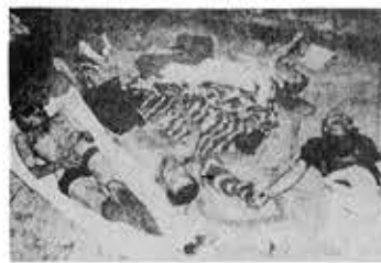
Πάνω άπό 2000 δολοφονημένοι στις «έπιχει- ρήσεις» 10 άπαγχονισμοί