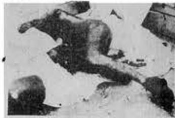
200 άτομα νεκροί άπό βασανιστήρια