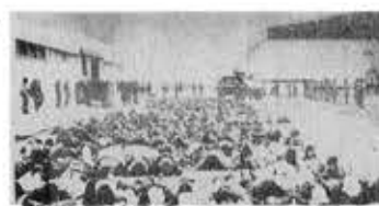
Έκατοντάδες χιλιάδες συλλήψεις