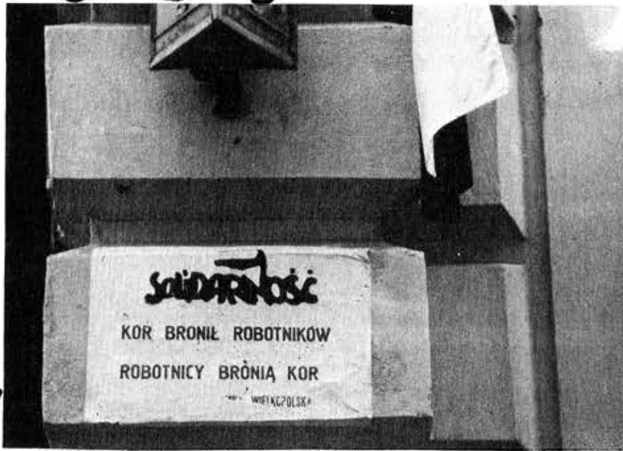
"Τό ΚΟΡ υποστήριξε τούς εργάτες, οί εργάτες υποστήριζον τό ΚΟΡ"

Ερώτηση: Τί υποστηρίζει αυτή η στιγμή τό ΚΟΡ γιά τήν εξέλιξη τής κατάστασης στην Πολωνία;