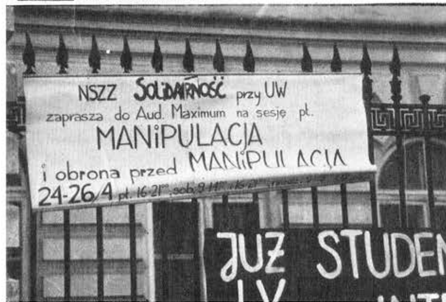
Από το Πανεπιστήμιο της Βαρσοβίας.

Απάντηση: Η ΝΖΣ δεν είναι μία άντισοσιαλιστική οργάνωση όπως