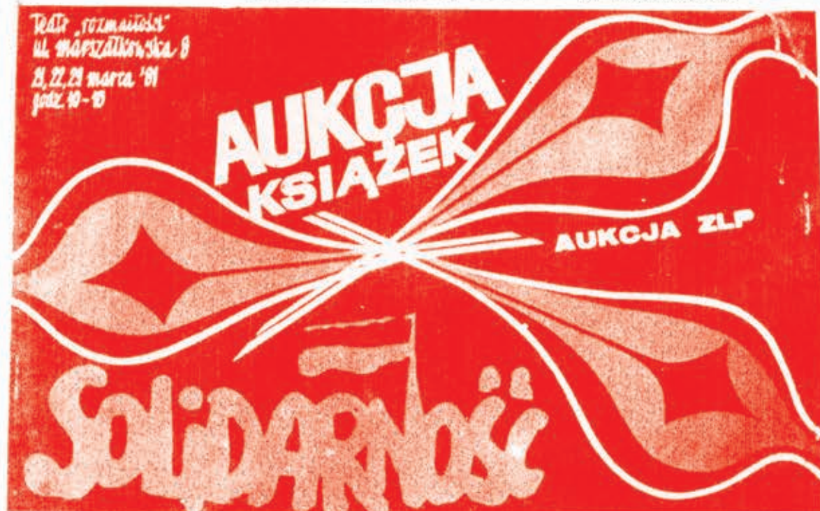
Άφίσσα της Άλληλεγγύης.

Για αυτό άκριβώς είναι άνοιχτό τό έρώτημα πώς θά αντιμετώπισει ή Άλληλεγγύη τήν "άνανεωτική" τακτική και θά παραμένει άνοιχτό, στο βαθμό που δέν διαμορφώνεται κάποια τάση που νά καλύπτει τό κενό της στρατηγικής προοπτικής αυτού του κινήματος.