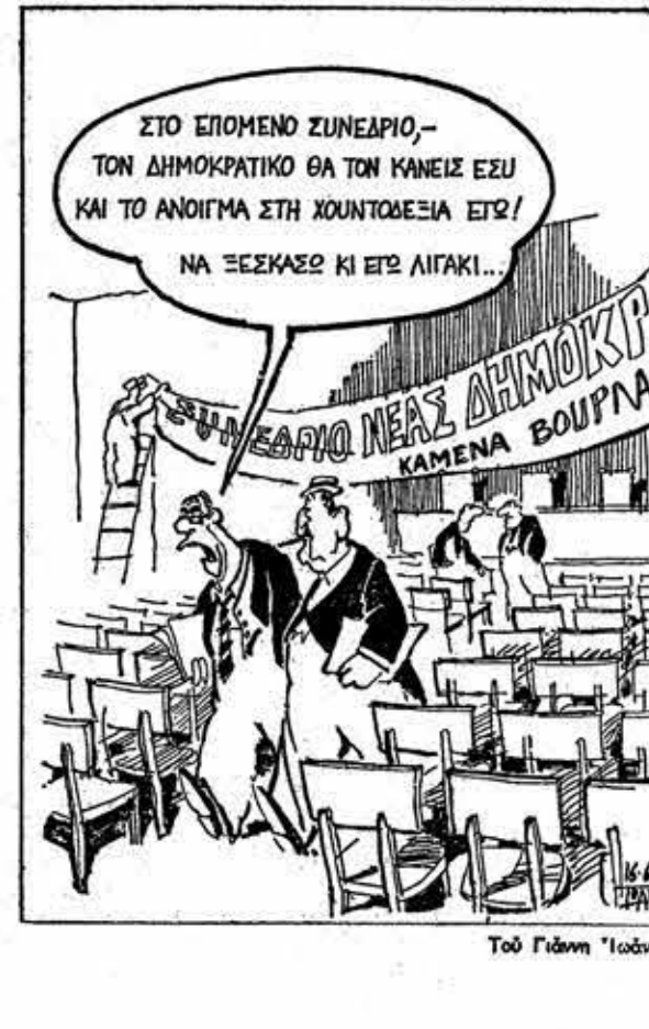
Το Γάλλο "Ινδιάνο"

Η ριζοσπαστικοποίηση που προκάλεσε η δικτατορία μέσα στα μικροαστικά κόμματα, τόσο τα παραδοσιακά όσο και τα νέα επειδή δεν όφαινε περιβάριο για την πολιτική έκφρασή τους, το κενό που όφαινε η κρίση της ρομητιστικής άρση (ΚΚΕ, ΚΚΕΣ, ΕΔΑ) και τέλος οι ανακατατάξεις που δημιουργήθηκαν (είσα η ανάπτυξη του κεφαλαιοκρατικού και συστηματοποίησης τους από την "Νέα Δημοκρατία" έδωσαν την δυνατότητα στα ΠΑΣΟΚ να δημιουργήσει ένα νερό δρομητήριο με δημοκρατικές εξορρολογισμένες διαλεγμένες της οικονομίας. "Λαϊκές" σχέσεις με όλες τις χώρες σαν "δημοκρατική" έκδοση του άνομιου από Μέση Ανατολή-Βαλκάνια "κοινωνικοποίηση" σαν "δημοκρατική" έκδοση του κρατικού παρεμβατισμού, συμμετοχισμού και κοινωνική χρηματοδότηση για τους παραδοσιακούς μικροεπενδυτές σαν "δημοκρατική" έκδοση για την εκσυγχρονιστική ύπερ των παλιών κομμάτων και όχι ύπερ των άλλων Λαζουρών, το ΠΑΣΟΚ παρουσιάζει τη δράση ενός μικροαστικού παραδοσιακού κομματος τον περίοδο που τα μικροαστικά στρώματα νοιάζονται έσοδος να βλαστάρει κάτω από τα πόδια τους. Το πιο σημαντικό όμως είναι ότι το ΠΑΣΟΚ καταφέρει να δημιουργήσει αυτή τη βάση μέσα σ' αυτά τα στρώματα και όχι στην μαζική επιρροή του ΠΑΣΟΚ και του ΚΚΕ για το πέρασμα των μέτρων που απαιτεί ο αστικός εκσυγχρονισμός, χωρίς κλυδωνισμούς και δ-