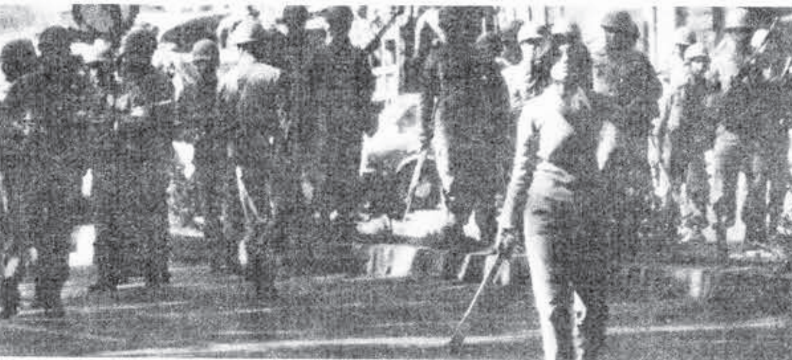
Στους δρόμους της Τεχεράνης ό φόβος έχει σβήσει.