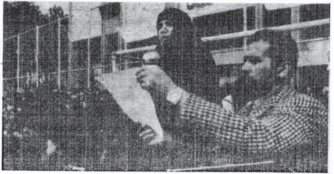
Οι αντιδραστικές προκαταλήψεις λιώνουν στην φωτιά της επανάστασης: μουσουλμάνοι μιλήτρια σε εργατική συγκέντρωση.