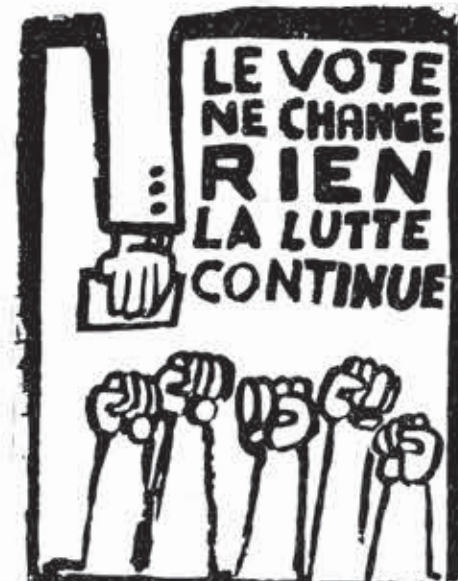
Η ψήφος δεν αλλάζει τίποτα