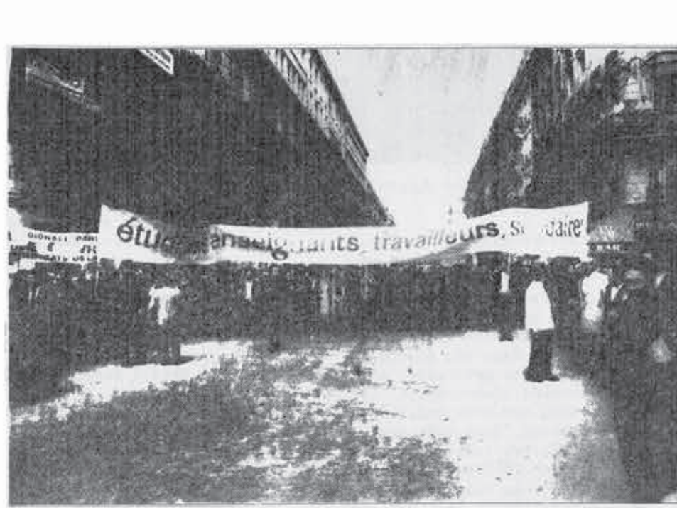
Φοιτητές, δασκάλιοι, εργάτες ένωμενοί