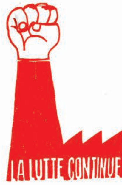
Η πάλη συνεχίζεται.