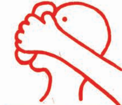
ρεφορμισμός - χλωροφόρμιο