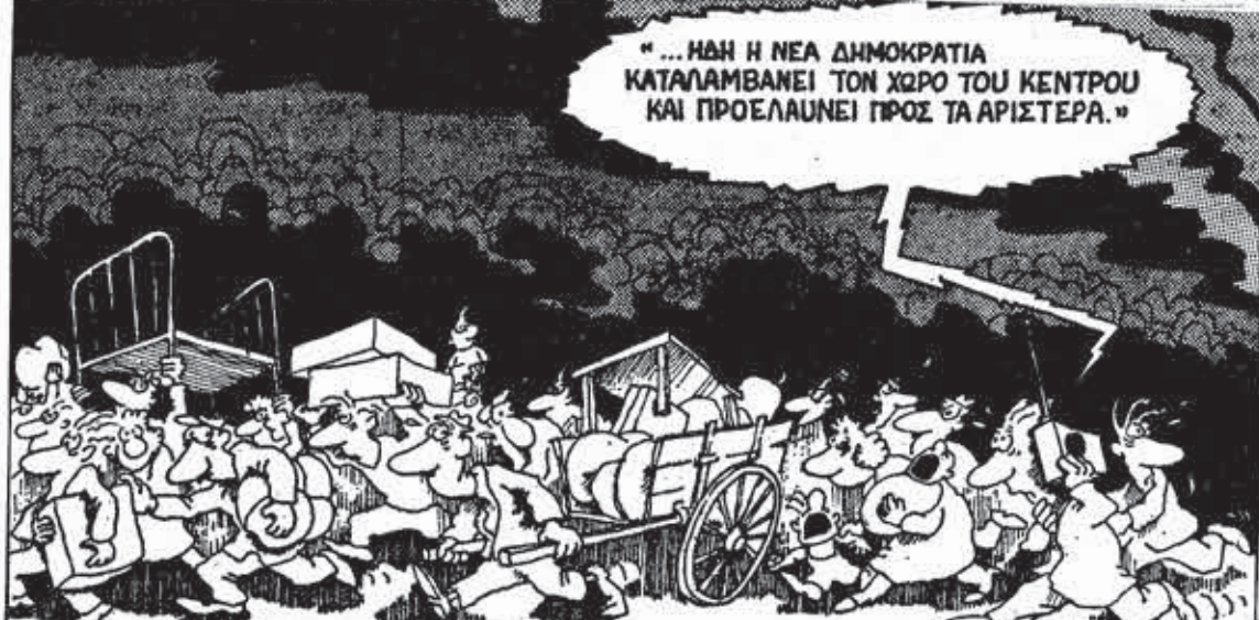
"... Η ΝΕΑ ΔΗΜΟΚΡΑΤΙΑ ΚΑΤΑΛΑΜΒΑΝΕΙ ΤΟΝ ΧΩΡΟ ΤΟΥ ΚΕΝΤΡΟΥ ΚΑΙ ΠΡΟΕΛΑΥΝΕΙ ΠΡΟΣ ΤΑ ΑΡΙΣΤΕΡΑ."

Μέσα απ' αυτές τις εκλογές περνάει ο δρόμος της αντίστασης στις επιθέσεις της κυβέρνησης και των άφεντικιών και όχι μέσα από συμβουλές στον Καραμανλή για τόν "πώς λύνονται τόν προβλήματα τόν τόπου".