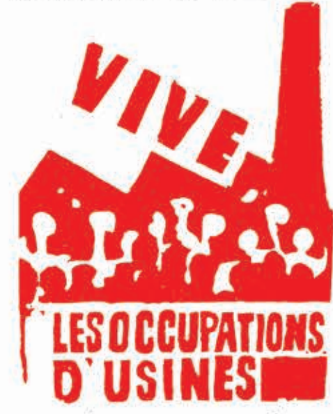
Ζήτω οι καταλήψεις των έργων - στασιών.